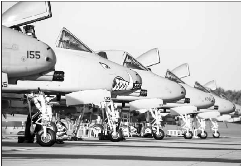
дислокації штурмовиків у Естонії не повідомляють. Тим часом у Вашингтоні вже

Ескадрилья американських штурмовиків A-10 Thunderbolt II дислокується на авіабазі Емарі під Таллінном. Сюди вони прибули у другій половині вересня для участі у спільних навчаннях Альянсу. Ескадрилья A-10 входить до складу двадцять третьої авіагрупи ВПС США, дислокованої на авіабазі Муді, що у Джорджії. Наразі про причини подовження